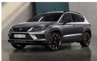
Gris Rodium [F6F6] Gratuit