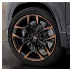
Jante alliage 20" CUPRA Machined Black Copper De série