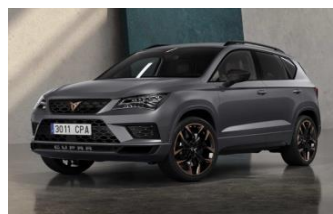
Gris Graphène [R6R6] 130 €